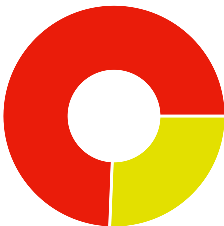
Ekvivalens energia fogyasztás

Földgáz: 338 642,225 kWh Villamos energia: 983 280,75 kWh