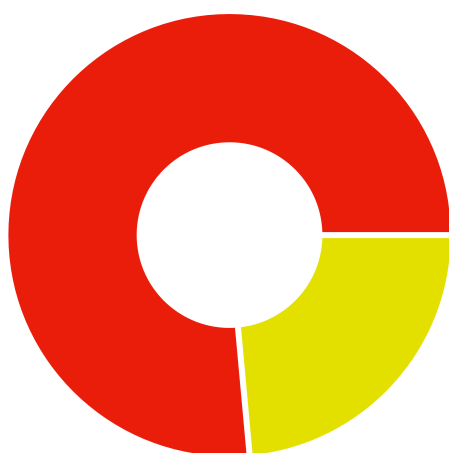
Ekvivalens energia fogyasztás

Földgáz: 269 885,28 kWh Villamos energia: 876 103 kWh